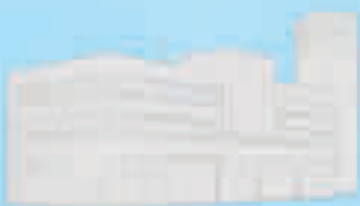
4 centru de coordonare

Un echipaj de pompieri are în dotare diferite vehicule, pe care le folosesc în cazul unui incendiu: