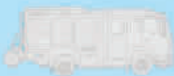
vehicul de stingere a incendiilor