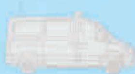
vehicul de coordonare a operațiunii